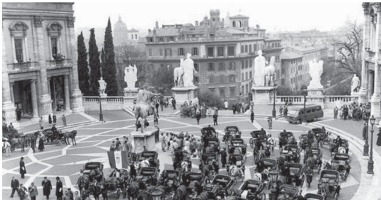
Raduno dei vetturini sulla piazza del Campidoglio, 1963

La rassegna è suddivisa in tre sezioni tematiche: la prima, dedicata al paesaggio urbano, raccoglie immagini del centro e della periferia di Roma, delle borgate e delle ville storiche, nel segno delle profonde trasformazioni che la città ha vissuto, sia a livello urbanistico e architettonico, che dal punto di vista sociale. La seconda sezione della mostra “Vita in Comune. 1930 - 2007. Fotografie di Roma dall'Archivio dell'Ufficio Stampa del Campidoglio”, ospitata nelle sale del Museo di Roma di Palazzo Braschi, è dedicata invece ai grandi eventi, alle feste popolari, ma