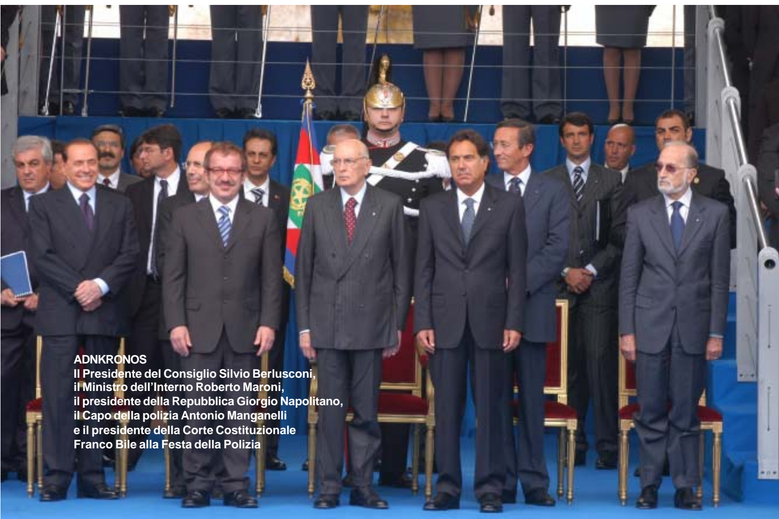
Il Presidente del Consiglio Silvio Berlusconi, il Ministro dell'Interno Roberto Maroni, il presidente della Repubblica Giorgio Napolitano, il Capo della polizia Antonio Manganelli e il presidente della Corte Costituzionale Franco Bile alla Festa della Polizia

Ricco il programma delle esibizioni con le dimostrazioni degli atleti delle Fiamme Oro, delle unità cinofile, dei rocciatori e degli