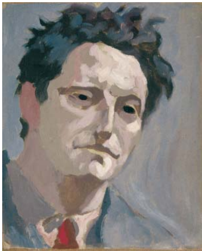
Carlo Levi - Autoritratto, 1945. Olio su tela conservato presso la Fondazione Carlo Levi a Roma.