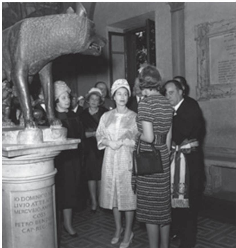
La regina Elisabetta II in visita ai Musei capitolini, 1961