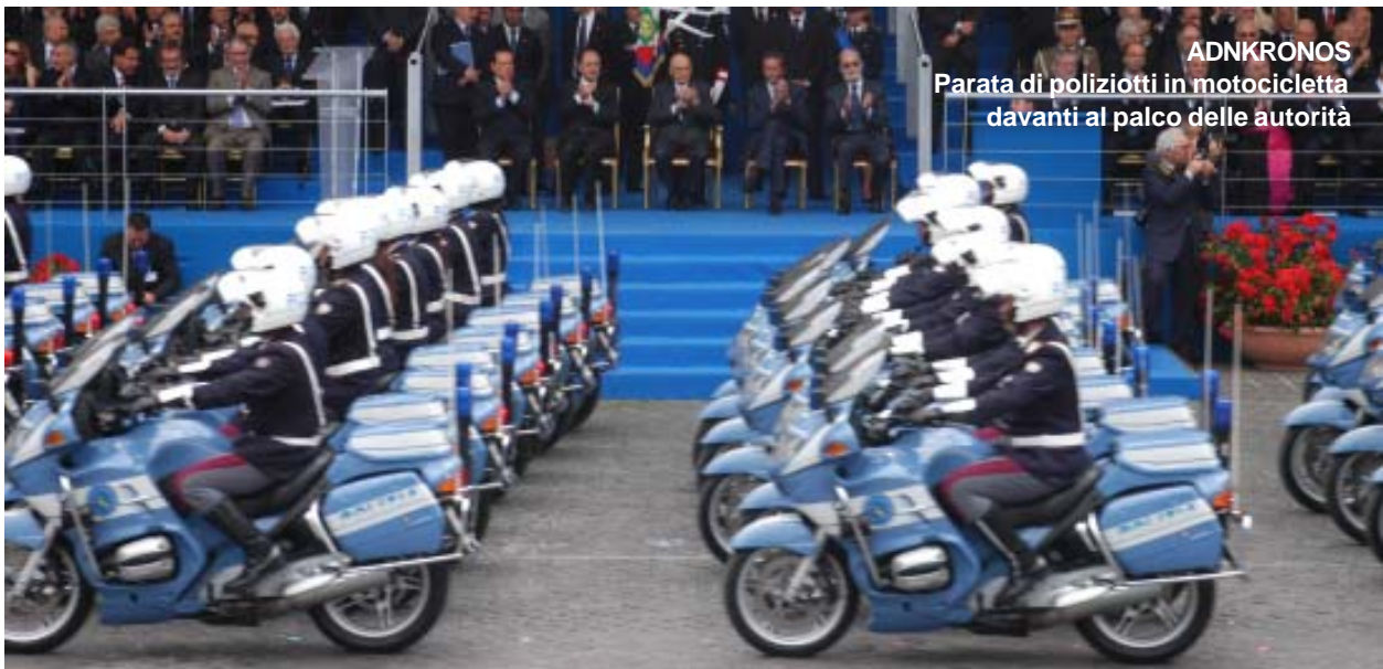
Parata di poliziotti in motocicletta davanti al palco delle autorità

istruttori di guida sicura e tecniche operative Le Fiamme Oro si esibiranno nelle discipline che hanno regalato numerose medaglie al gruppo sportivo. I cinofili simuleranno le tecniche nei piu' svariati casi di intervento con una dimostrazione dei cani piu' esperti impiegati in ordine pubblico, nei servizi antidroga per la ricerca di sostanze stupefacenti, nell'antisabotaggio in materia di esplosivi, e infine utilizzati per il rintraccio di latitanti. Gli istruttori di Tecniche Operative e di Scuola Guida dell'Istituto di Nettuno si esibiranno in una serie di slalom con incroci tra autovetture