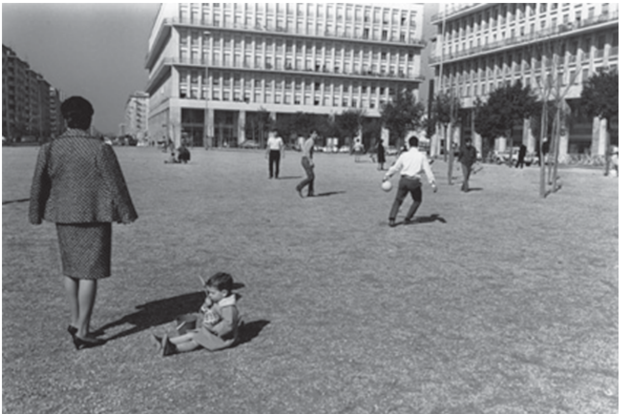
Piazza don Bosco, 1967

anche ai momenti piu' tristi che hanno coinvolto la collettività romana. Scatti che raccontano la tradizionale Festa dei' Noantri, passando attraverso le storie di vita comune, fino ad arrivare al periodo d'oro della discoteca "Piper".