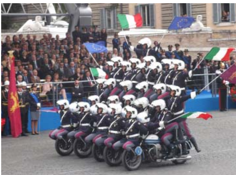
ADNKRONOS La piramide di poliziotti motociclistisfila in Piazza del Popolo

È stata deposta una corona d'alloro presso l'Altare della Patria, mentre alle ore 15.15, la Polizia di Stato svolgera' servizio di Guardia d'Onore al Palazzo del Quirinale.