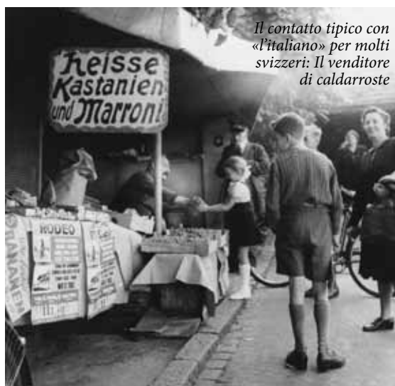
Il contatto tipico con «l'italiano» per molti svizzeri: Il venditore di caldarroste