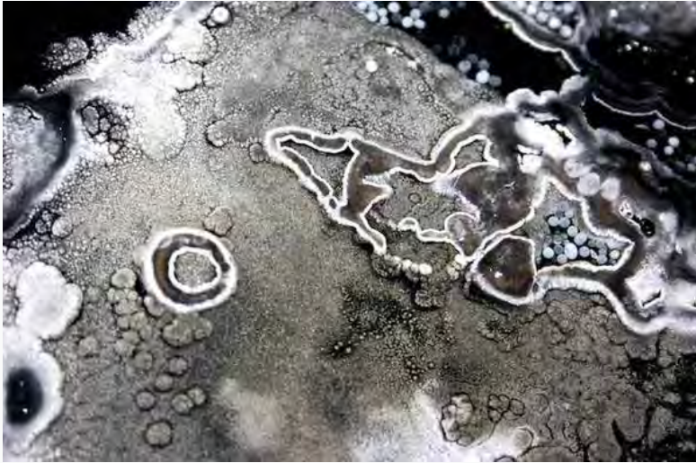
Il Corsaro Nero. Suolo, depositi misti in pozza d'acqua con forte presenza calcitica e piccole pisoliti