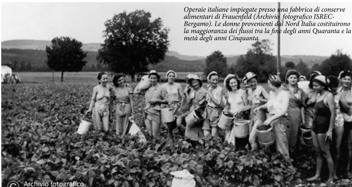
Operaie italiane impiegate presso una fabbrica di conserve alimentari di Frauenfeld. Le donne provenienti dal Nord Italia costituirono la maggioranza dei flussi tra la fine degli anni Quaranta e la metà degli anni Cinquanta.

stato proprio la ricerca continua dell’italianità, della curiosità verso la sua cultura, di una nostalgia (almeno in apparenza) placata per quello che avevo sempre sentito come il luogo simbolico delle mie radici, a prescindere da dove la vita mi aveva portato, riportato e poi sempre portato indietro. A casa”. A proposito della lingua, invece, o le lingue che si parlano in Svizzera, basta il ricordo della sciatrice Lara Gut: “...La domanda più frequente che mi veniva rivolta quando ero piccola e conoscevo dei bimbi italiani in vacanza era: «ma tu parli lo svizzero?» ed io scoppiai a ridere. Come spiegare loro delle nostre quattro lingue ufficiali, come far loro capire che anche in Svizzera si parla italiano anche se non viviamo in Italia? Siamo una piccola nazione che ha «preso in prestito» le lingue dai paesi che ci attorniano e viviamo questo plurilinguismo in modo bizzarro e prettamente svizzero”.