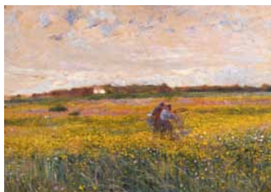
Plinio Nomellini "I ranaioli", olio su tela del 1901