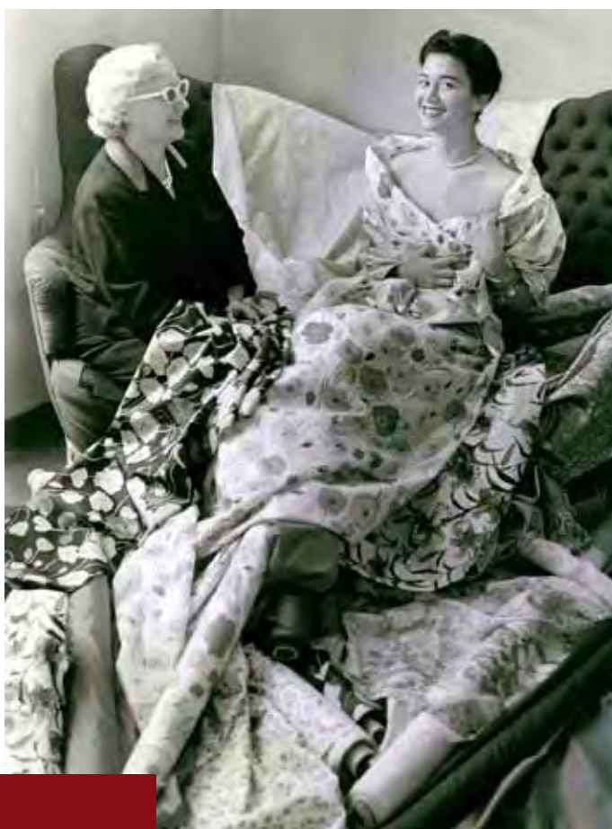
Abajo. Jole Veneziani fotografata da Ugo Mulas. Archivio Jole Veneziani, Fondazione Bano