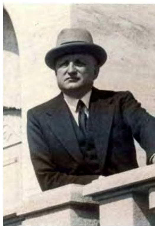
Ermenegildo Zegna in una foto degli anni '50

Un'eredità trasmessa alla quarta generazione dei Zegna che hanno voluto capitalizzare il bagaglio storico e culturale del loro patriarca creando a Trivero 'Casa Zegna', nuovo polo di aggregazione culturale e sede dell'archivio storico contenente, tra l'altro, preziosi campionari di tessuti (10mila tessuti in 600mila varianti), disegni, bozze di campionario. 'Casa Zegna' è stata realizzata all'interno di un edificio degli anni '30 accanto al Lanificio Ermenegildo Zegna, affidato all'architetto Gianmaria Beretta che ha ripensato gli interni integrando una suggestiva serra di Pietro Porcinai, rivisitata da Paolo Pejrone. Per festeggiare i primi 100 anni l'azienda biellese ha raccolto la propria storia in uno splendido volume, edito da Skira, 'Ermenegildo Zegna. Cento anni di tessuti, innovazione, qualità e stile'. Diviso in quattro sezioni (la Mente, la Mano, lo Stile, l'Ambiente) il prezioso volume ripercorre, con le foto di Mimmo Jodice e Mattias Klum, la storia di una delle grandi famiglie dell'imprenditoria italiana. Dal fondatore del Lanificio, Ermenegildo Zegna, descritto come un "uomo