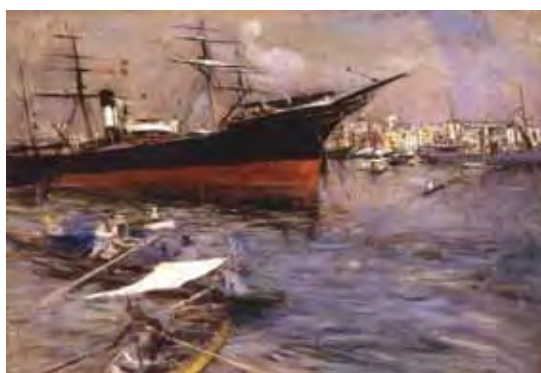
Giovanni Boldini "Navi nel bacino di San Marco a Venezia", olio su tavola del 1899