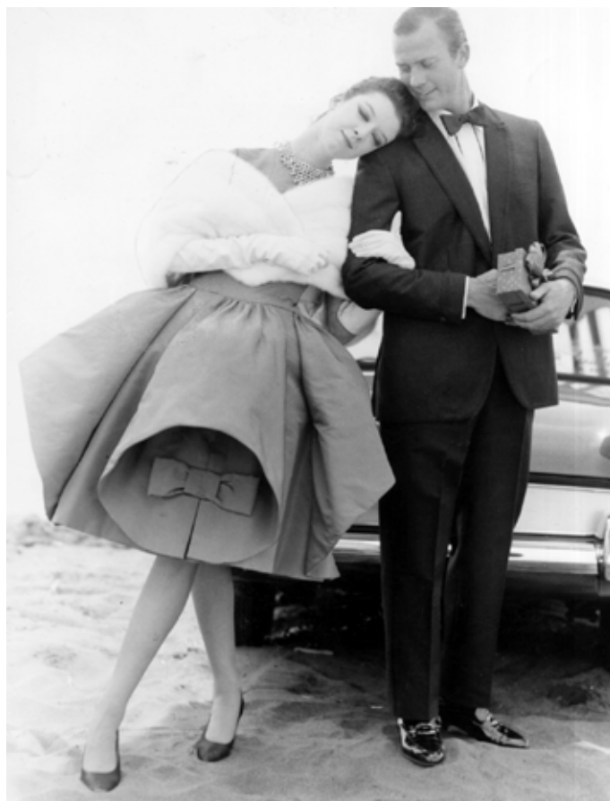
Arriba. Smoking anni '60.