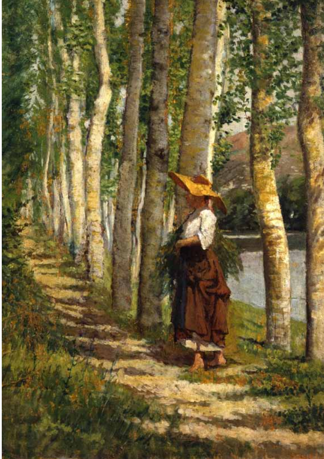
Giovanni Fattori "Contadina fra i pioppi", olio su tavola del 1875