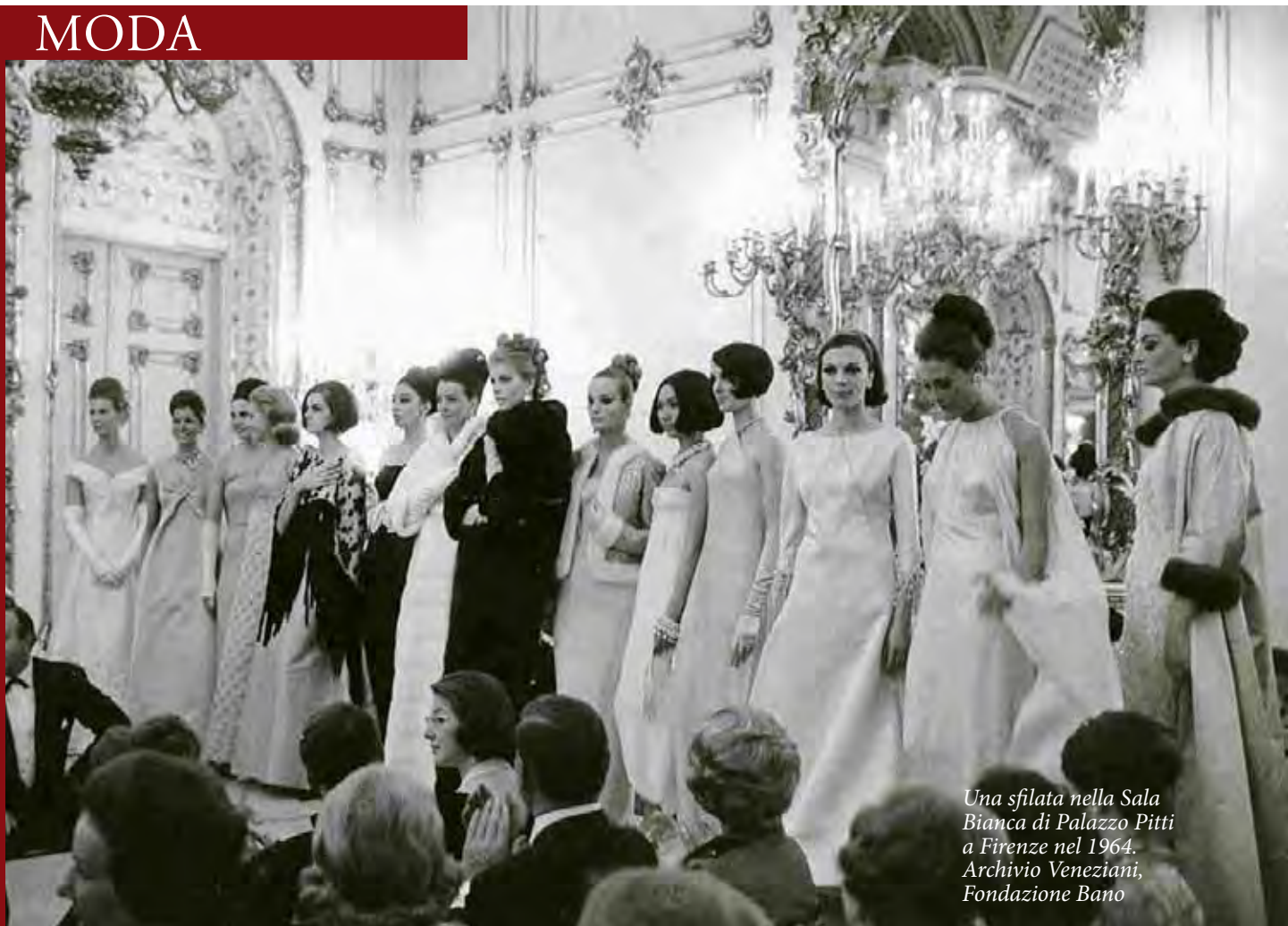
Una sfilata nella Sala Bianca di Palazzo Pitti a Firenze nel 1964.