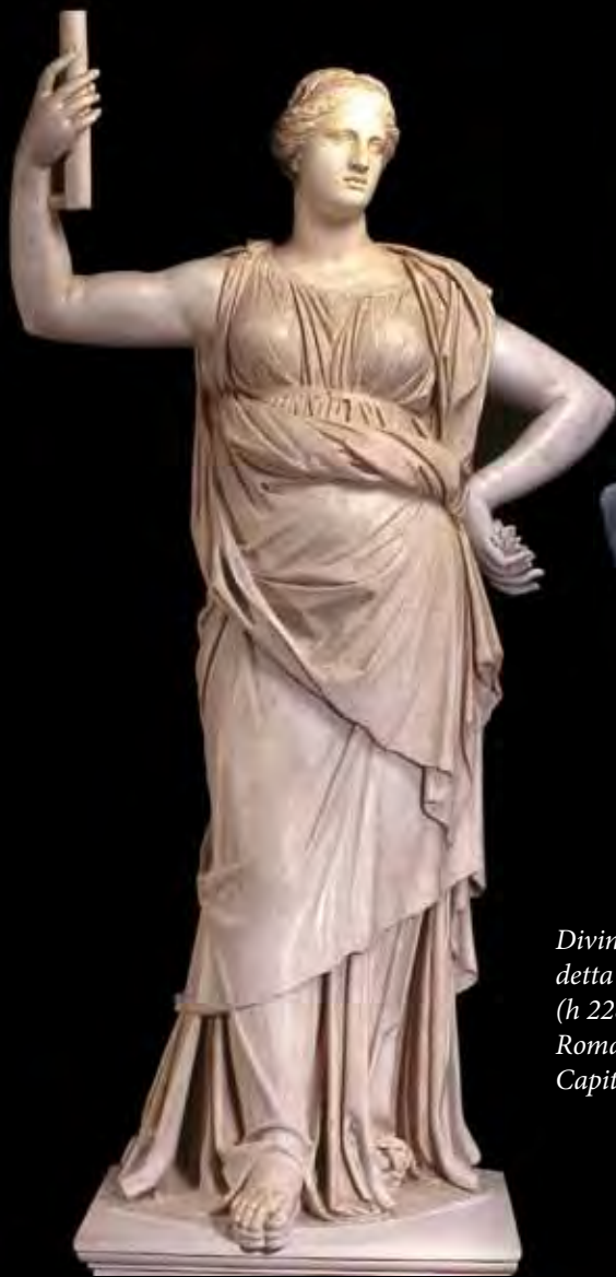
Divinità femminile, detta "Giunone Cesi" (h 228 cm) in marmo Roma, Musei Capitolini