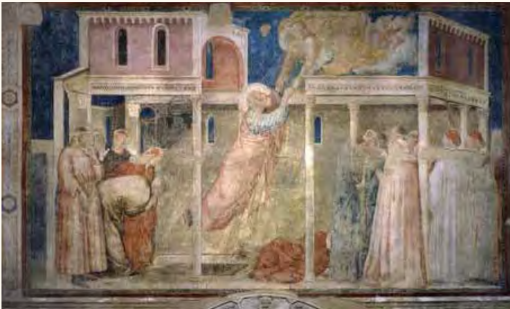
L'affresco attribuito a Giotto, nella Cappella Peruzzi della basilica di Santa Croce a Firenze

Riaffiora un Giotto sconosciuto e straordinario dall'esame compiuto per la prima volta con raggi ultravioletti degli affreschi della Cappella Peruzzi della basilica di Santa Croce a Firenze. Esame condotto dalla Getty Foundation di Los Angeles in collaborazione con l'Opificio delle pietre dure. Il risultato, è stato spiegato stamani dagli esperti, è "il vero Giotto oggi scomparso, in quanto il maestro ha usato la pittura a secco per superare alcuni limiti propri dell'affresco usando leganti proteici che non hanno resistito al tempo e che hanno nascosto ai nostri occhi l'immagine complessiva dell'affresco originale, ritenuto dai contemporanei il capolavoro del maestro". La nuova tecnologia ha permesso così di scoprire i volumi, i volti, i ricchi panneggi e i decori sontuosi delle vesti, i modellati, la tridimensionalità dei dipinti come realmente creati dal pittore e che oggi non sono più visibili con questa definizione. (Adnkronos)