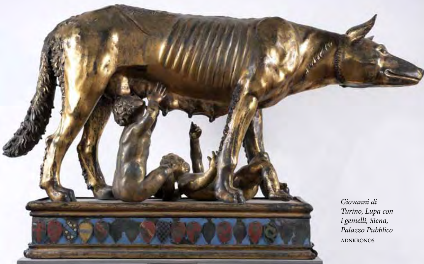
Giovanni di Turino, Lupa con i gemelli, Siena, Palazzo Pubblico

sezioni tematiche, una dedicata alla fortuna dei pittori senesi del Quattrocento, con pezzi come La Madonna dell'Umiltà di Gentile da Fabriano del 1425, e l'altra dedicata alle influenze di Donatello sui nuovi protagonisti dell'arte senese, come Lorenzo di Pietro detto il Vecchietta e Matteo di Giovanni. La grande esposizione di Siena sarà anche l'occasione per riscoprire la città e incentivare un turismo di appassionati. Il percorso, infatti, ricomprenderà non solo la città di Siena ma anche paesi limitrofi coinvolti nella straordinaria e fervida attività artistica del primo Rinascimento senese, da San Gimignano a Pienza. "Ci auguriamo fortemente - ha auspicato Marcello Flores d'Arcais, assessore alla Cultura del Comune di Siena - che questa primavera l'afflusso di visitatori sia costituito sempre più da un turismo culturale, di tradizione intellettuale e passione artistica". Un modo, secondo l'assessore, per tentare di travalicare "il mordi e fuggi che purtroppo spesso caratterizza il turismo nostrano". (Adnkronos)