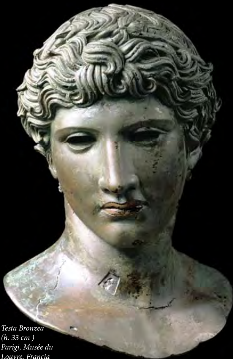
Testa Bronzea (h. 33 cm ) Parigi, Musée du Louvre, Francia