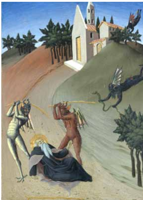
Sant'Antonio battuto dai diavoli, New Haven, Yale University Art Gallery