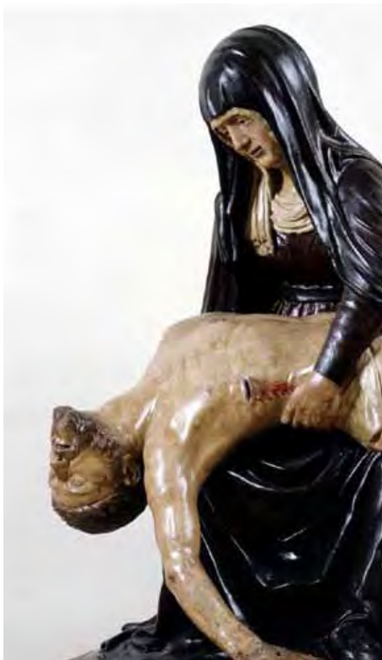
Lorenzo di Pietro detto il Vecchietta, Pietà, Siena, Museo Diocesano