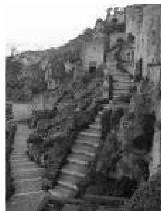
Sassi di Matera

Dietro ogni porta si cela una meraviglia architettonica. La tipologia delle abitazioni (caverne, case a corte, case a schiera, palazzi e palazzotti) si differenzia sia per il periodo storico di riferimento che per la posizione orografica. Lo stesso si può dire per le costruzioni dedicate al culto religioso. Decine sono le chiese rupestri in città, centinaia in tutto il territorio a ridosso della gravina.