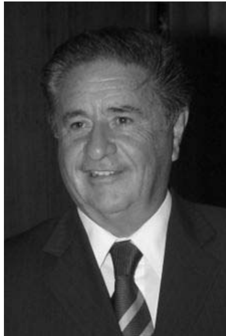
Ex Presidente Eduardo Duhalde

Nel suo intervento, l'ex Presidente Duhalde ha dichiarato che "la crisi è un problema creato dal capitalismo finanziario senza controllo, in quanto si