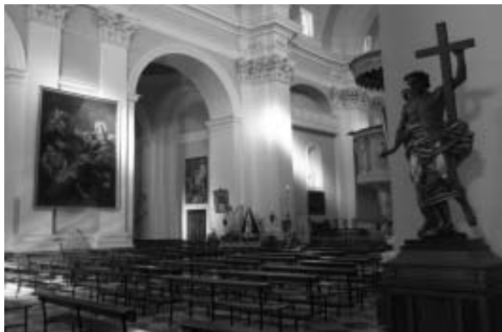
Cattedrale S.M.della Neve

Nuoro è situato su un altopiano granitico (altopiano di Nuoro), tra l'alto corso dei torrenti Isalle e Rio di Oliena. La città, dominata dal roccioso Ortobene (955 m), "su monte" dei Nuoresi, è in ottima