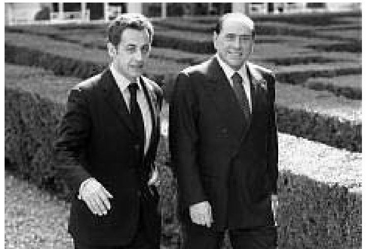
Sarkozy e Berlusconi