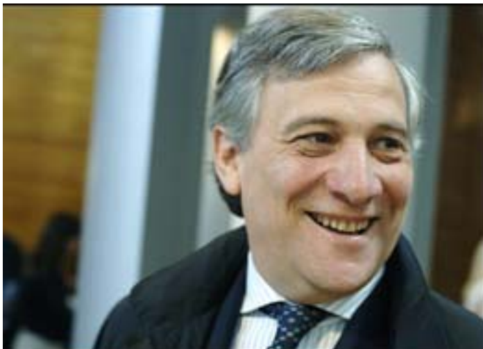
Commissione Europea - Antonio Tajani

L'Unione europea è sensibile alla tragedia dell'Abruzzo ed è già possibile ipotizzare un contributo di 500 milioni di euro da mettere a disposizione delle popolazioni terremotate. Lo ha affermato il vice presidente della Commissione europea, Tajani, che ha presieduto oggi all'Aquila una riunione organizzativa su disponibilità e utilizzo dei fondi europei. Tajani ha spiegato che per sostenere l'Abruzzo a livello comunitario si può lavorare su tre direttrici: quella, intanto, di «riconvertire» sugli interventi per il terremoto la quota parte dei fondi strutturali di 350 milioni già assegnata all'Abruzzo nell'ambito della ripartizione dei fondi strutturali 2007-2013; quella di accedere al fondo di solidarietà previsto per i paesi europei per le calamità naturali o eventi eccezionali, da cui è ipotizzabile ottenere una quota nell'ordine di qualche centinaia di milioni; quella, infine, ma più lunga e difficile, di ipotizzare un reinserimento dell'Abruzzo o della sola provincia dell'Aquila nei benefici dell'Obiettivo 1 che darebbe diritto ad ulteriori disponibilità finanziarie nonché ad agevolazioni di carattere fiscale.