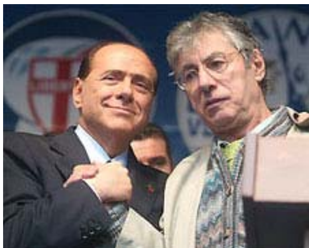
Silvio Berlusconi e Umberto Bossi

Roma - Accelerare il rimpatrio di almeno cinquecento immigrati e riproporre le norme su ronde e Cie nel disegno di legge sulla sicurezza calendarizzato per il 27 aprile alla Camera, magari blindandolo con la fiducia. Silvio Berlusconi cerca di uscire dall'angolo in cui la decadenza del decreto, ormai assodata, rischia di chiudere governo e maggioranza e, al tempo stesso, di ribadire la "politica di rigore" nei confronti degli irregolari.