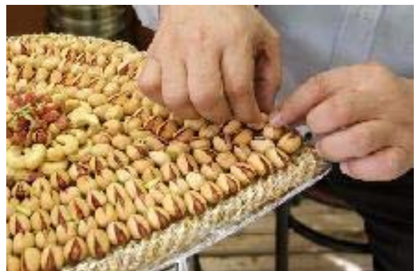
Pistacchi alla salmonella

La salmonella di origine alimentare ha già' causato una decina di decessi negli Usa nel 2009.