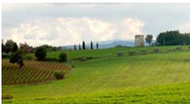
Territorio della provincia di Siena

Inoltre sono disponibili moltissime strutture extralberghiere quali: Affittacamere, Bed & Breakfast e case vacanza che offrono un'ospitalità genuina per far sentire l'ospite come a casa propria.