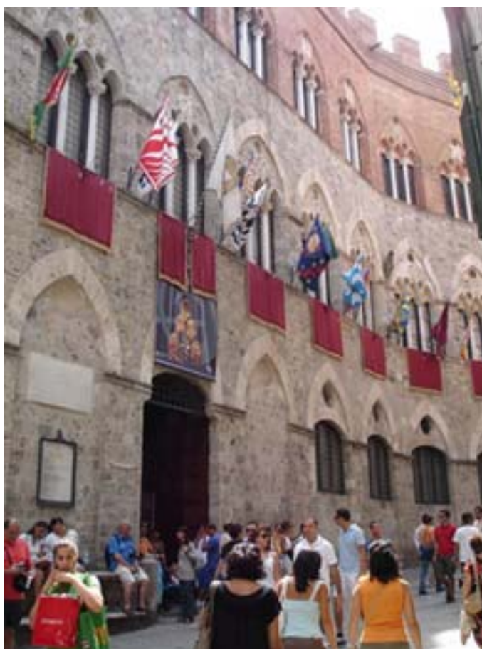
Accademia Musicale Chigiana