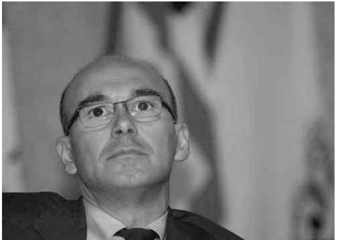
Il presidente della Regione Sardegna: Renato Soru

La Regione, successivamente, rimborsa ai comuni le somme erogate, dietro presentazione di apposita richiesta e dall'elenco nominativo degli elettori ammessi al contributo.