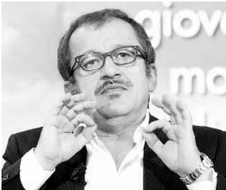
Ministro dell'Interno, Roberto Maroni

Come conta di intervenire il Viminale? "Bisogna prima capire. Ho commissionato un'indagine alla Cattolica di Milano. Dispongo della mappa esatta di tutti i centri islamici. Sto vagliando le proposte presentate in Parlamento, come quella della Lega per sottoporre a referendum locale l'apertura di nuove moschee. Quando avrò sufficienti elementi - dice Maroni - li porterò all'attenzione del governo e del Parlamento. Perché davvero non è una questione che possa risolvere il ministro degli Interni".