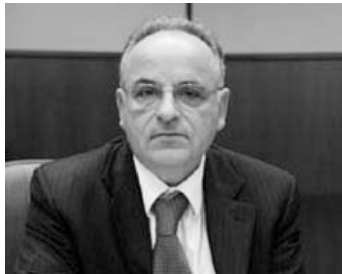
Direttore Generale dell'Inps, Vittorio Crecco

Crecco conclude la sua risposta affermando che l'INPS si limita a dar seguito a quanto stabilito dal legislatore. La senatrice Gai da parte sua promette il suo impegno a che "in questa legislatura possa essere finalmente varato un provvedimento di sanatoria degli indebiti pensionistici visto che l'INPS ritiene di non potere intervenire con un provvedimento amministrativo di sospensione del recupero".