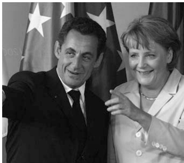
Angela Merkel e Nicolas Sarkozy