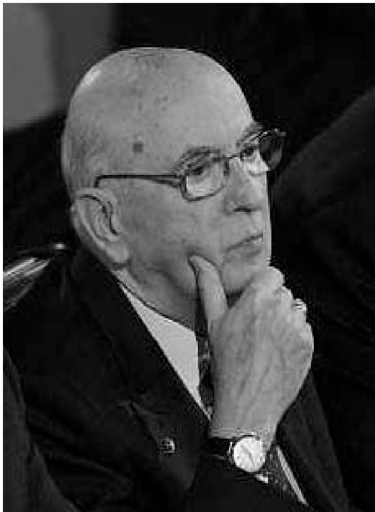
Il presidente della Repubblica: Giorgio Napolitano

Parole che hanno convinto maggioranza e opposizione. Immediata è giunta a Napolitano la telefonata di congratulazioni del presidente del Consiglio Silvio Berlusconi, e "vivo apprezzamento" è stato espresso dai presidenti di Senato e Camera Renato Schifani e Gianfranco Fini.