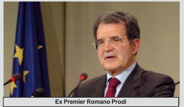
Ex Premier Romano Prodi

Prodi ricorda che l'euro nei primi mesi 'di vita' "ha ricevuto grandi bordate perché 'andava giù". Io dicevo, 'guardate, brontolerete quando l'Euro andrà' molto su'. Ed è quello che è avvenuto perché l'Euro è una moneta forte, sta cambiando il mondo. Viene presa come riserva e, ripeto, in questa crisi economica ha salvato la lira in modo particolare. In questo momento- conclude- noi saremmo preda di venti a cui non sappiamo resistere". <<