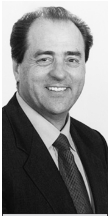
Antonio Di Pietro