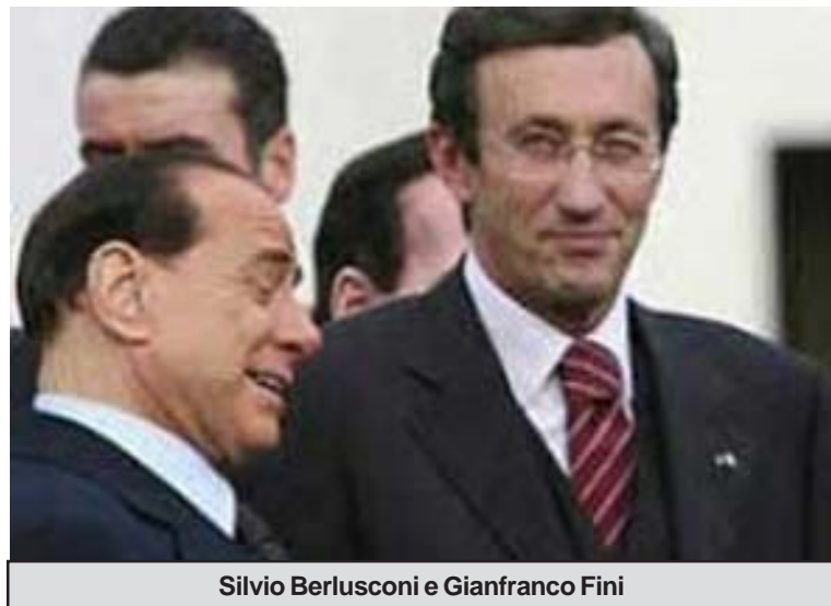
Silvio Berlusconi e Gianfranco Fini

Fini ha preso la parola in aula dopo una serie di interventi di deputati che hanno criticato l'intenzione manifestata dal presidente del Consiglio di ricorrere più frequentemente alla decretazione d'urgenza. Il presidente della Camera ha ricordato quanto affermato nel proprio di-