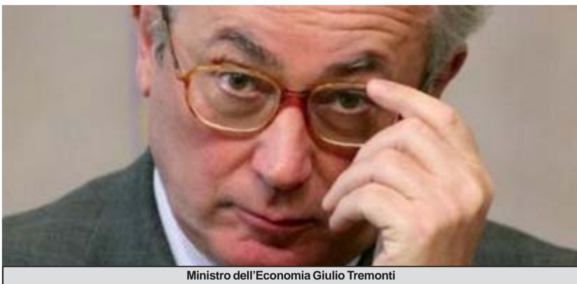
Ministro dell'Economia Giulio Tremonti

ROMA (Reuters)- Il ministro dell'Economia, Giulio Tremonti, riformula il famoso detto 'silete giuristi' (tacete giuristi, ndr) in "silete economisti". Intervenedo a un convegno di Confindustria dove il Centro studi di viale dell'Astronomia ha presentato un documento che parla dell'Italia come di un Paese in recessione, il ministro sottolinea che "il capitale intellettuale degli economisti si è azzerato: 'mark to market' vuol dire zero". Secondo Tremonti è "prudente non tenere conto di quello che dicono gli economisti" se non addirittura "fare